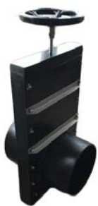
Zasuwy nożowe PE