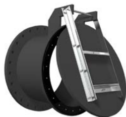
Kłapy zwrotne PEHD