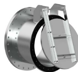
Kłapy zwrotne Nierdzewne