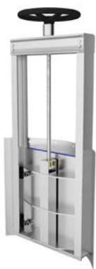
Zastawka z Przyłą