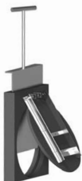
Zasuwa z Klapą